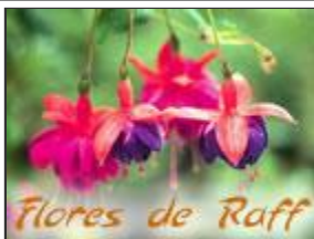
Flores de Raff