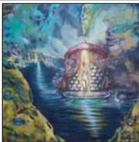
"Hay una vez..." Pinturas