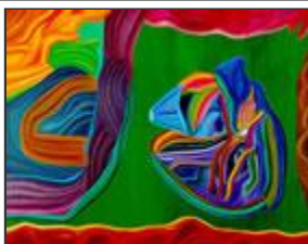
Pinturas del Tercer Milenio

"Niños Índigo" es el nombre dado a un grupo muy especial de seres que han elegido encarnar en nuestro planeta con una misión y un propósito específicos.