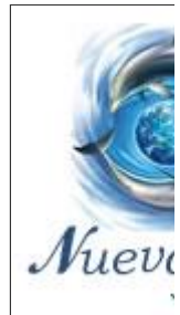
Portal y Tier